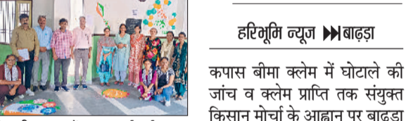
भिवानी। छात्राओं द्वारा बनाई गई रंगोली देखत अतिथि।