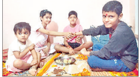
नारनौल। रक्षाबंधन पर्व मनाते बच्चे।

रक्षाबंधन को लेकर बाजार में खरीदारी करने भीड़ उमड़ पड़ी। सुबह से ही बाजारों काफी चहल पहल रही। पूजा अर्चना हुई, इसके बाद बहनों ने भाइयों के हाथों में रक्षा सूत्र बांधकर उनके माथे पर तिलक लगाकर दीर्घायु की कामना की। बहनों ने अपने भाइयों का मुंह मीठा करवाया। बदले में भाइयों ने बहनों को उपहार आदि भेंट किए, साथ ही