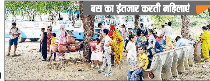
बस का इंतजार करती महिलाएं