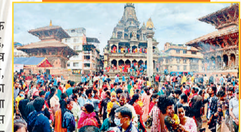
कांडमांडू स्थित कृष्ण मंदिर में जन्माष्टमी उत्सव

मुंबई में कृष्ण जन्माष्टमी का उत्सव देश के दूसरे हिस्सों से बिल्कुल अलग जोश और उल्लास के साथ मनाया जाता है। इस दिन महाराष्ट्र के लगभग हर शहर में और उसमें भी विशेष तौर पर मुंबई में हर गली में एक ऊंचे स्थान पर दो पेड़ों या दो इमारतों के बीच बंधी रस्सी में बीचों-बीच जहां चारों तरफ खुला मैदान होता है, बहुत ऊंचे एक हांडी बांधी जाती है, जिसमें दही, मिठाईयां और रुपए भरे होते हैं। कृष्ण के बाल सखा माने जाने वाले गोविंदा मानव पिरामिड का आकार बनाकर हवा में हांडी तक पहुंचते हैं और फिर इसे तोड़ते हैं। मुंबई में जन्माष्टमी के दिन गोविंदाओं की टोलियां दही-हांडी उत्सव में घूम-घूमकर हिस्सा लेती हैं और जब एक टोली हांडी तक नहीं पहुंच पाती, तो दूसरी टोली को उसके लिए मौका दिया जाता है। हांडी फोड़ने वाले मित्रमंडल/टोलियों को उत्सव का आयोजन करनी सोसायटी या मुहल्ला पुरस्कृत करता है। *