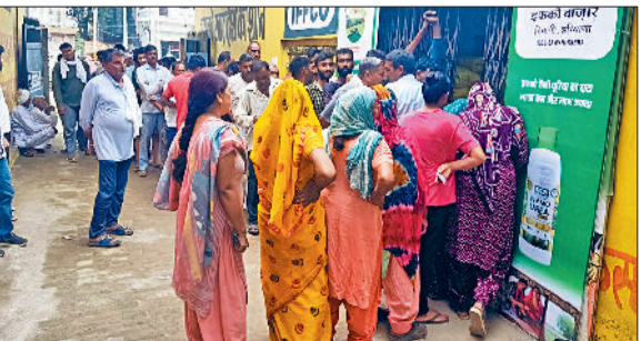
बवानीखेड़ा। खाद के लिए लाइनों में लगी महिला किसान।

लगता है कि यूरिया व डीएपी खाद की कमी किसानों के साथ साए की तरह चिपक गई है। खरीफ फसल का आधे से ज्यादा सीजन बीतने के बावजूद भी किसानों को खाद नहीं मिल पा रही है। अब भी किसान खाद के लिए मारे मारे फिर रहे हैं। ऐसा ही नजारा शनिवार को बवानीखेड़ा में एक खाद की एजेंसी