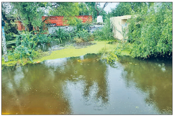
भिवानी। गांव सागवान में घरों व भवनों में घुसा बरसाती पानी।