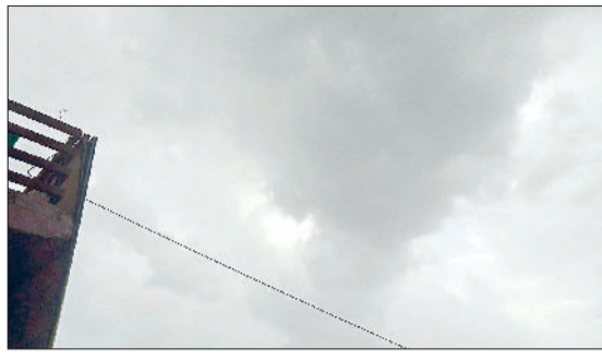
नारनौल। आसमान में छाए बादल।

स्थानों पर हल्की बारिश व बूदाबांदी हुई। जिससे सम्पूर्ण इलाके में दिन व रात के तापमान में हल्की गिरावट देखने को मिली। हरियाणा एनसीआर दिल्ली में अधिकतर स्थानों दिन व रात के तापमान सामान्य से नीचे बने हुए हैं। जिले में सुबह से शाम तक लगातार बादलों की आवाजाही के बीच हल्की बारिश व बूदाबांदी हुई। जिससे मौसम सुहावना बना रहा। जिले में नारनौल व महेन्द्रगढ़ का दिन तथा रात का तापमान क्रमशः 34.5, 25.5 डिग्री सेल्सियस व 34.0, 27.2 डिग्री सेल्सियस दर्ज किया गया।