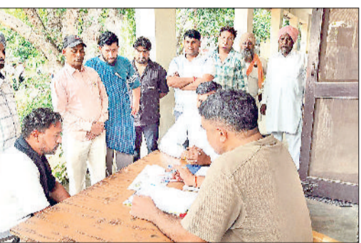
महेंद्रगढ़। कारवाई में जुटी पुलिस की टीम।

जानकारी के अनुसार एक ट्रक हाइवे की तीसरी लेन में खराब हालत में खड़ा था और उसके पीछे संकेतक भी लगाए गए थे। इसी दौरान महाराष्ट्र की ओर जा रहे