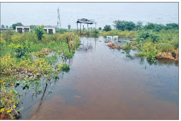
भिवानी। गांव सागवान के शमशान घाट परिसर में जमा बरसाती पानी।

गांव के शमशान घाट, पंचायत घर, आंगनवाड़ी केन्द्र, अखाड़ा, जलघर और स्कूल में मरा पानी हरिभूमि न्यूज़ ►►तोशाम/ भिवानी