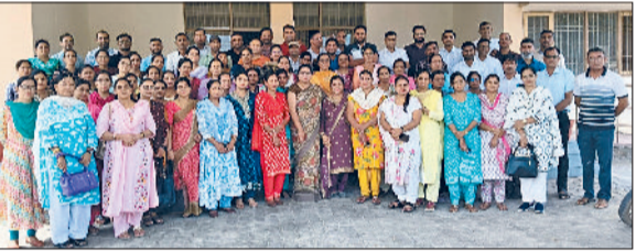
बवानीखेड़ा। राजकीय कन्या वरिष्ठ माध्यमिक विद्यालय लोहाड़ में प्रभावी कक्षा अवलोकन शिविर का समापन में कर्मचारी व अधिकारियों।