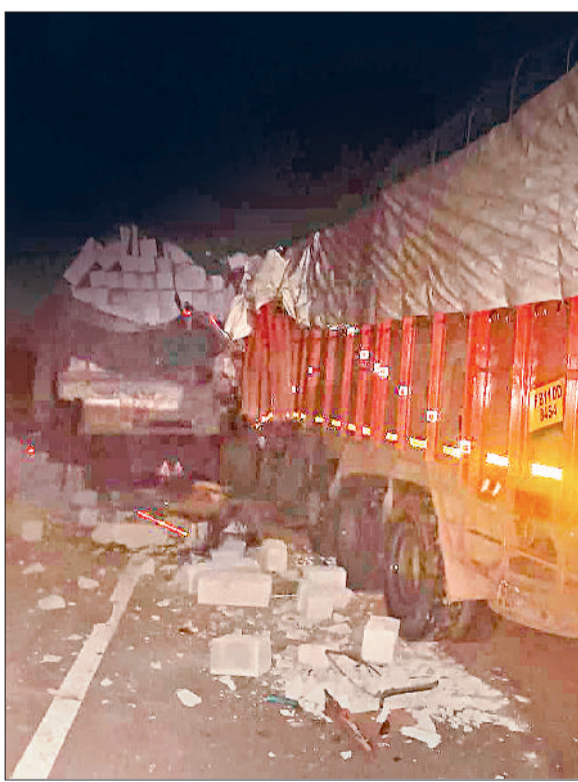
महेंद्रगढ़। हादसे के बाद मौके पर खड़ा ट्रक।

लोगों का कहना है कि आकोदा से बसई जाने के लिए नेशनल हाइवे-148 बी से टर्न लेकर मुड़ते समय सड़क पर थोड़ी ऊंचाई है। इस कारण नए और अनुभवहीन चालक अक्सर तेजी से गाड़ी चलाते हैं। यहां पहले भी कई हादसे हो चुके हैं। आज का हादसा भी इसी चढ़ाई पर स्पीड और नियंत्रण खोने के कारण हुआ। वागीणों ने मोड़ पर स्पीड ब्रेकर और चेतावनी बोर्ड लगाने की मांग की है।