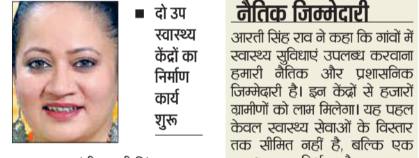
स्वास्थ्य मंत्री आरती सिंह राव।

स्वास्थ्य मंत्री आरती सिंह राव ने कहा कि हरियाणा सरकार का उद्देश्य ग्रामीण क्षेत्रों में स्वास्थ्य सेवाओं को सुलभ, समग्र और गुणवत्तापूर्ण बनाना है। इसी कड़ी में मुख्यमंत्री नायब सिंह सैनी द्वारा 24 जुलाई को दादरी जिले में पांच नए उप-स्वास्थ्य केंद्र भवनों का शिलान्यास किया। इन भवनों का निर्माण तीन करोड़ 14 लाख रुपये की लागत से किया जाएगा। दादरी जिले के भांडवा, चिड़िया, खेड़ी बुरा, कलियाना और चंदेनी गांवों में बनाए जाएंगे। स्वास्थ्य मंत्री ने बताया कि स्वस्थ गांव, सशक्त समाज अभियान के तहत शुरू की गई यह महत्वाकांक्षी परियोजना ग्रामीणों को अपने ही क्षेत्र