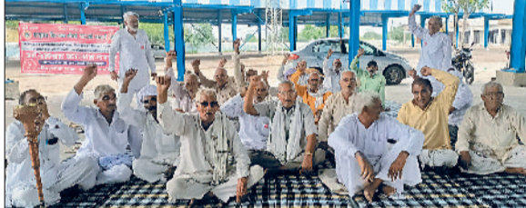
बाढ़ड़ा। कस्बे की अनाज मंडी में घरने पर नारेबाजी करते किसान।