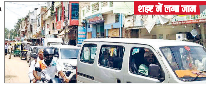
शहर में लगा जाम

रही। यात्रियों ने आरोप लगाया कि रोडवेज की ओर से अतिरिक्त बसें नहीं चलाई गईं, जबकि पहले से अंदाजा था कि रक्षाबंधन पर भीड़ अधिक होगी। वहीं परमिट बस संचालकों के लिए यह दिन जमकर कमाई करने वाला साबित हुआ।