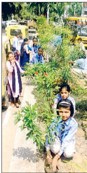
महेन्द्रगढ़। पौधरोपण करते स्कूल के विद्यार्थी।