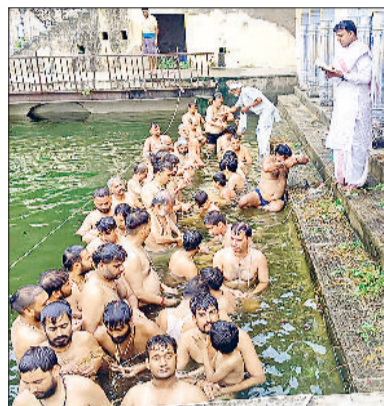
नारनौल। शिव कुंड ढोसी में स्नान करते विप्रजन व ढोसी में आयोजित कार्यक्रम में भाग लेते विप्रजन।