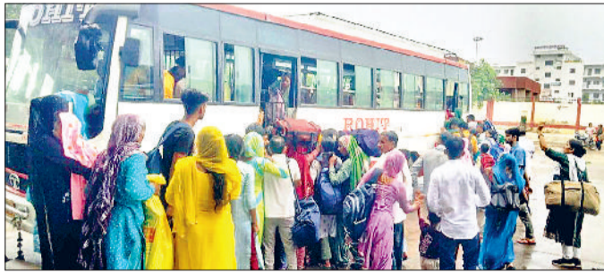
महेंद्रगढ़। बस में चढ़ती महिलाएं।

रोडवेज बस स्टैंड पर स्थिति यह थी कि बसें आते ही 10 से 15 मिनट में भरकर रवाना हो जा रही थी। बस स्टैंड के समीप बसों का इंतजार कर रही महिलाओं की लंबी कतारें देखी गईं। इस कमी का