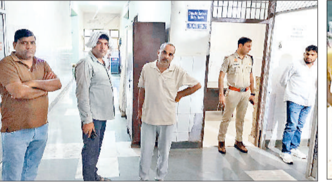
महेंद्रगढ़। हादसे के मौके पर पहुंचे मृतक के परिजन व हादसे के बाद पल्टी कार।