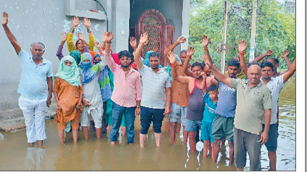
बवानीखेड़ा। पानी की निकासी की मांग को लेकर नारेबाजी करते हुए।

एक लाख रुपये प्रति एकड़ मुआवजा दिए जाने की मांग की है। इसके साथ गांव को पीने का पानी, पशुओं के लिए चारा, किसानों के